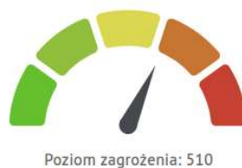
Rys. 3. Wskaźnik poziomu zagrożenia na granicy poziomu "poważny"