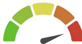
Rys. 4. Wskaźnik poziomu zagrożenia na poziomie "bardzo poważny"

Na podstawie danych z dotychczasowych fal pandemii, oraz danych z fali Delta z terenu krajów sąsiednich, spodziewamy się, że czas lokalnego utrzymywania się poziomu "bardzo poważny" nie przekroczy czterech tygodni. Jeśli w tym okresie wypada, zgodnie z rozkładem